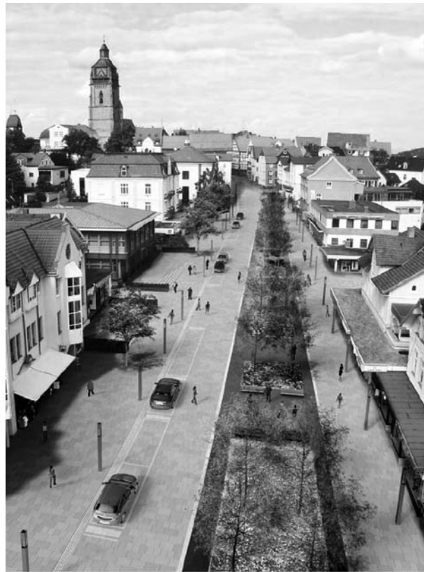
Gegenüberstellung Scharnier vorher (li.) / nachher (re.) (Isometrie) aus der Infobroschüre der Stadt

tagskompetenz der örtlichen Verwaltungen und lokalen Politiker mit der Fachkompetenz von Architekten, Einzelhandelspezialisten, Verkehrs-, Stadt- und Regionalplanern.