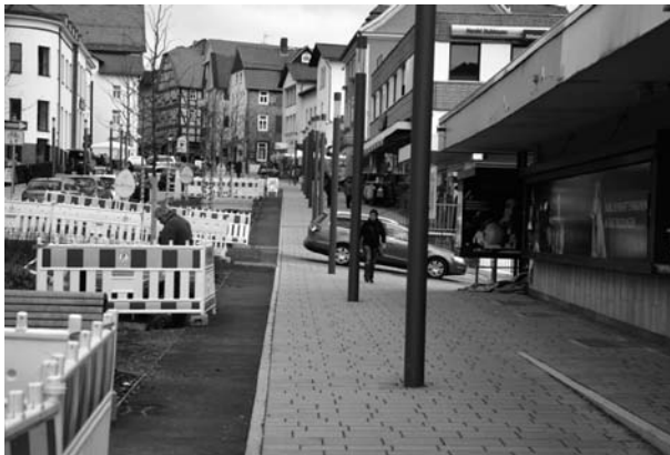
Scharnier aktuell

Seit 2011 wurde der Altstadttring aufgebrochen: Nach und nach wurden fünf Kreisel gebaut und zwischen ihnen der Gegenverkehr eingeführt. Ausgenommen blieb das Scharnier, der nur etwa 60 m lange Abschnitt zwischen Alt-